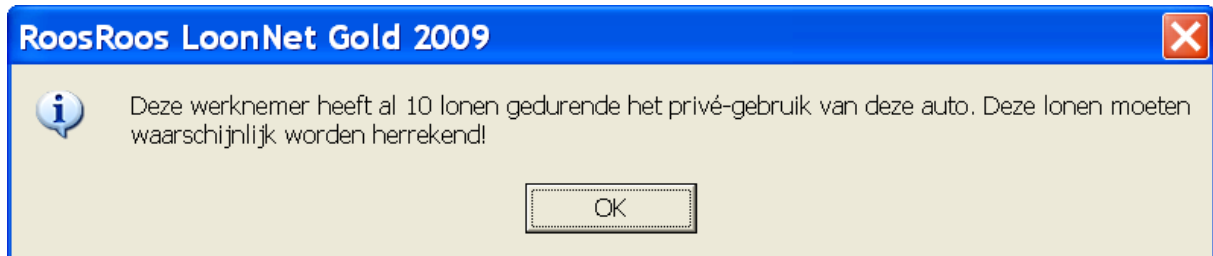
Afbeelding: Het dialoogscherm Auto van de zaak 'alsnog'

Loon is daarbij zo 'slim' u deze melding te laten zien: