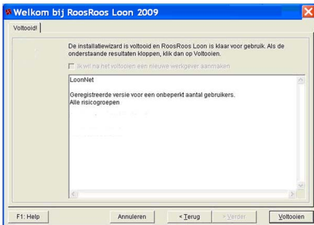
Het dialoogscherm 'Welkomstwizard', 'Voltooid'

Dit is het laatste scherm van de welkomst- en installatiewizard. Hierna kunt u de Loon-gegevens 2008 gaan importeren via de import-wizard.