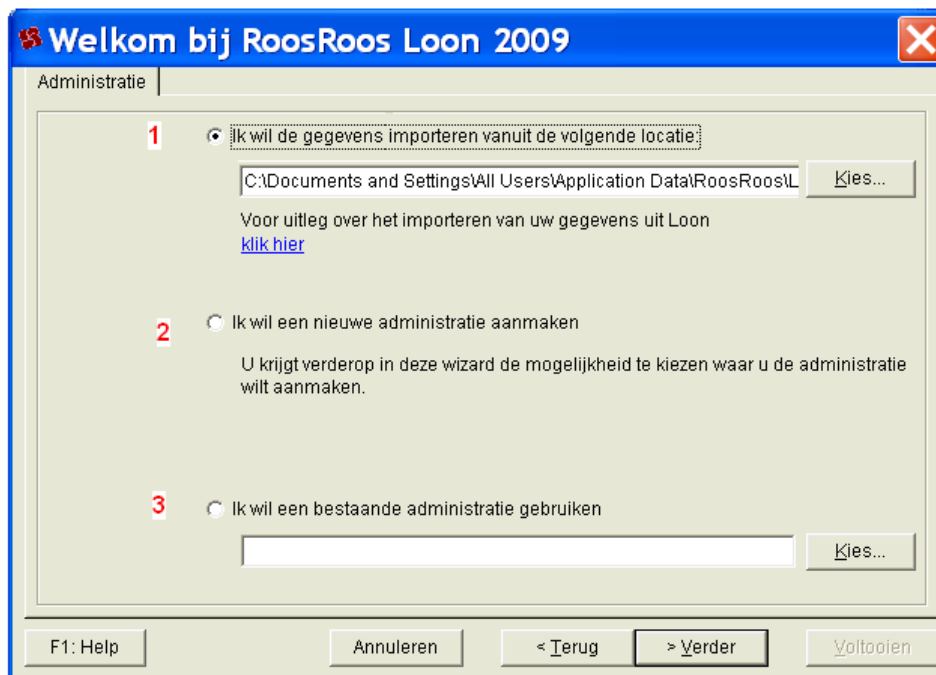
Het dialoogscherm 'Welkomstwizard', 'Administratie'

Dit is het scherm dat u te zien krijgt in de welkomst-wizard bij de stap 'Administratie':