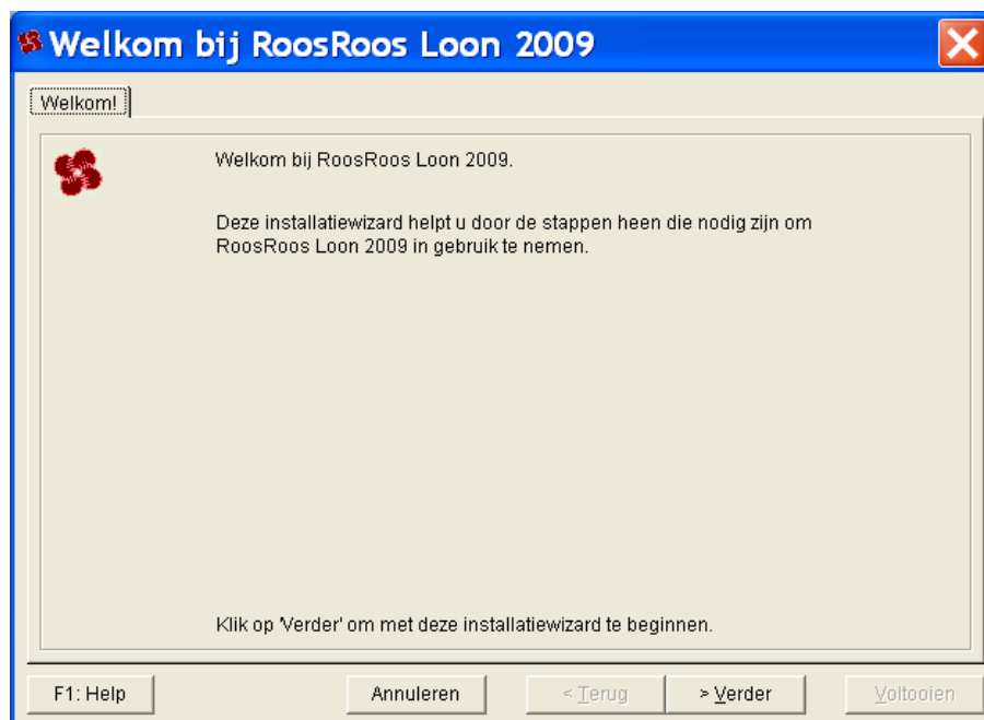
Het dialoogscherm 'Welkomstwizard', 'Welkom'

Na een aantal installatieschermen, belandt u in de Welkomstwizard Loon 2009: