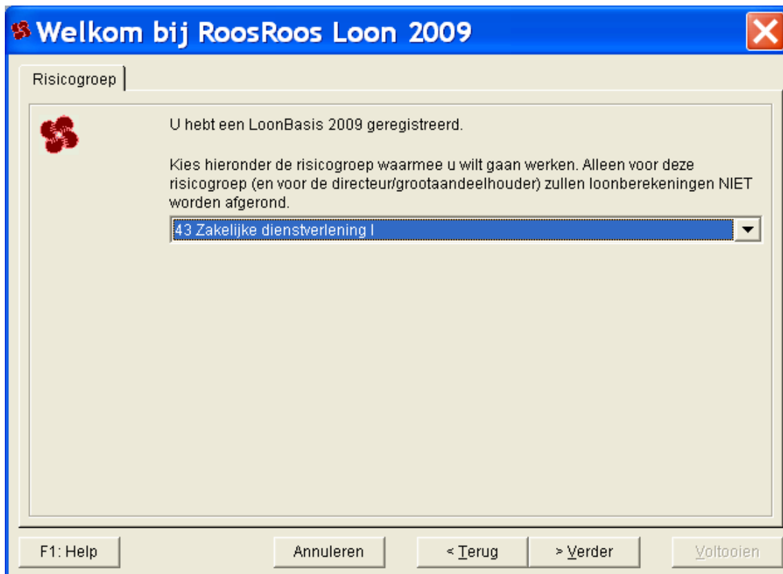
Het dialoogscherm 'Welkomstwizard', 'Risicogroep' (LoonBasis)