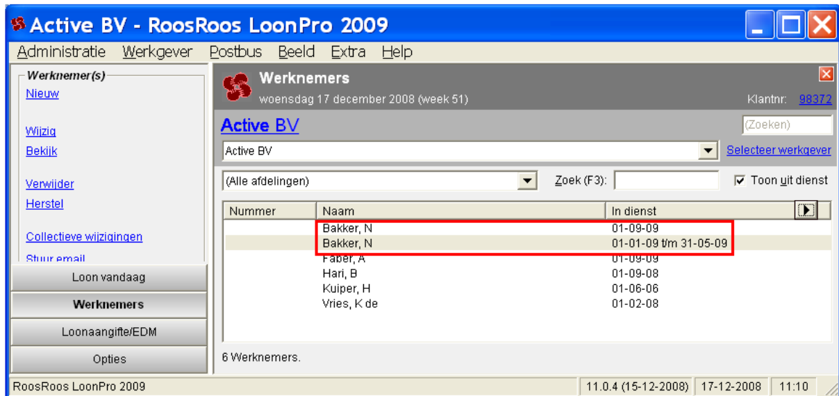
Afbeelding: Het dialoogvenster Werknemers , twee dienstverbanden 'Bakker'

Loon zal er dan voor zorgen dat er in de lijst van werknemers twee dienstverbanden staan bij deze werknemer. Namelijk één van 01-01-09 t.m. 31-05-09. En één vanaf 01-09-09: