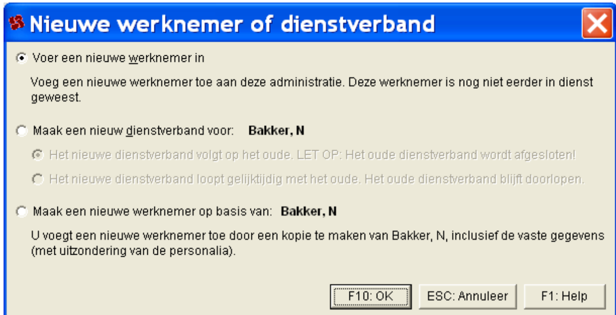
Afbeelding: Het dialoogvenster Nieuwe werknemer of dienstverband

U krijgt nu bij de optie 'Nieuw' vanuit het werknemersscherm vier mogelijkheden te zien. Het scherm ziet er zo uit: