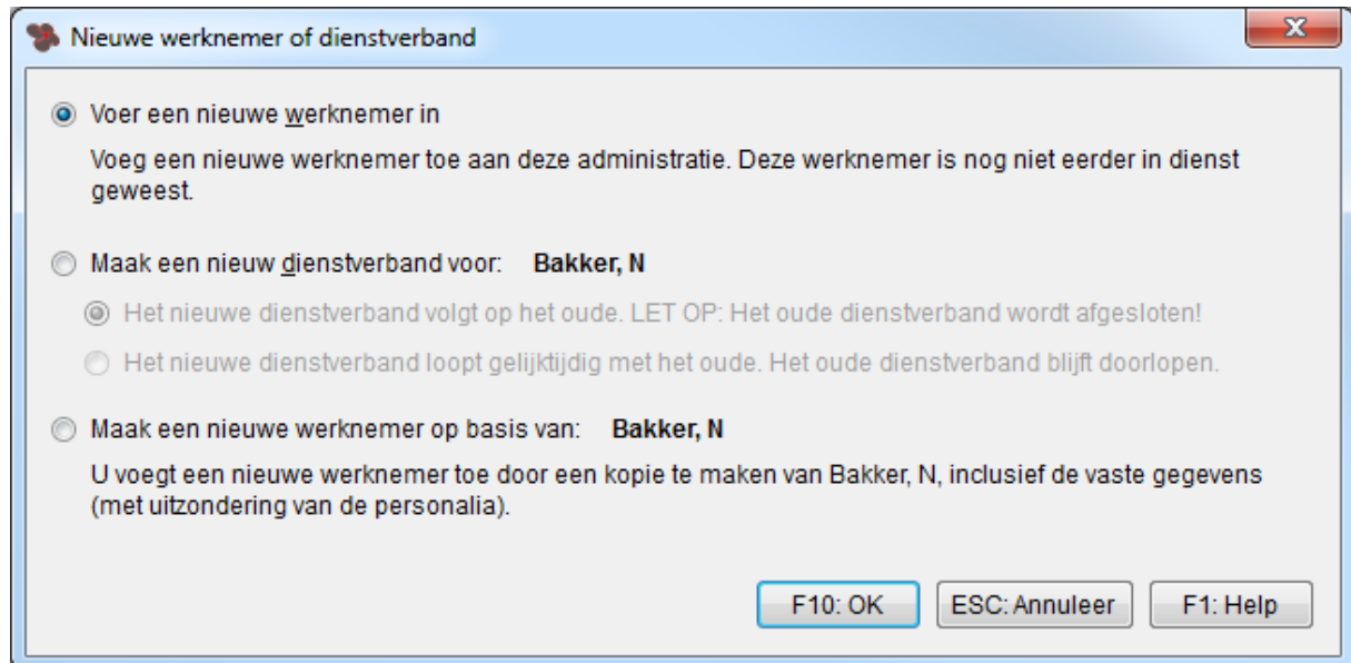
Afbeelding: Nieuwe werknemer of dienstverband

U krijgt nu bij de optie 'Nieuw' vanuit het werknemersscherm vier mogelijkheden te zien. Het scherm ziet er zo uit: