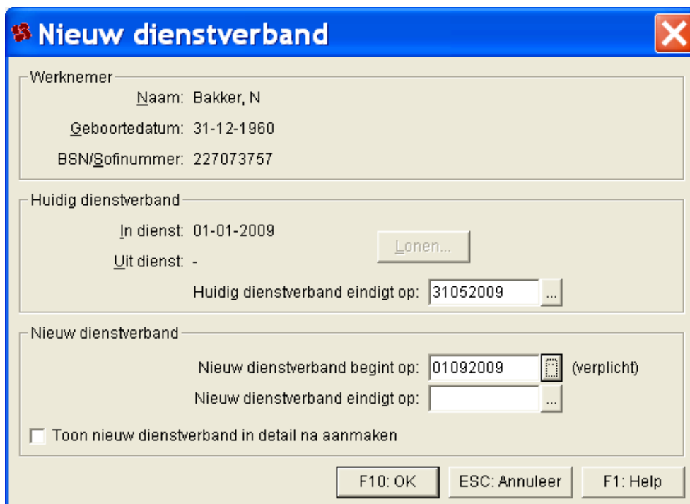
Afbeelding: Het dialog- en invulvenster Nieuw dienstverband

Na uw keuze voor 'Het nieuwe dienstverband volgt het oude op' belandt u in dit scherm: