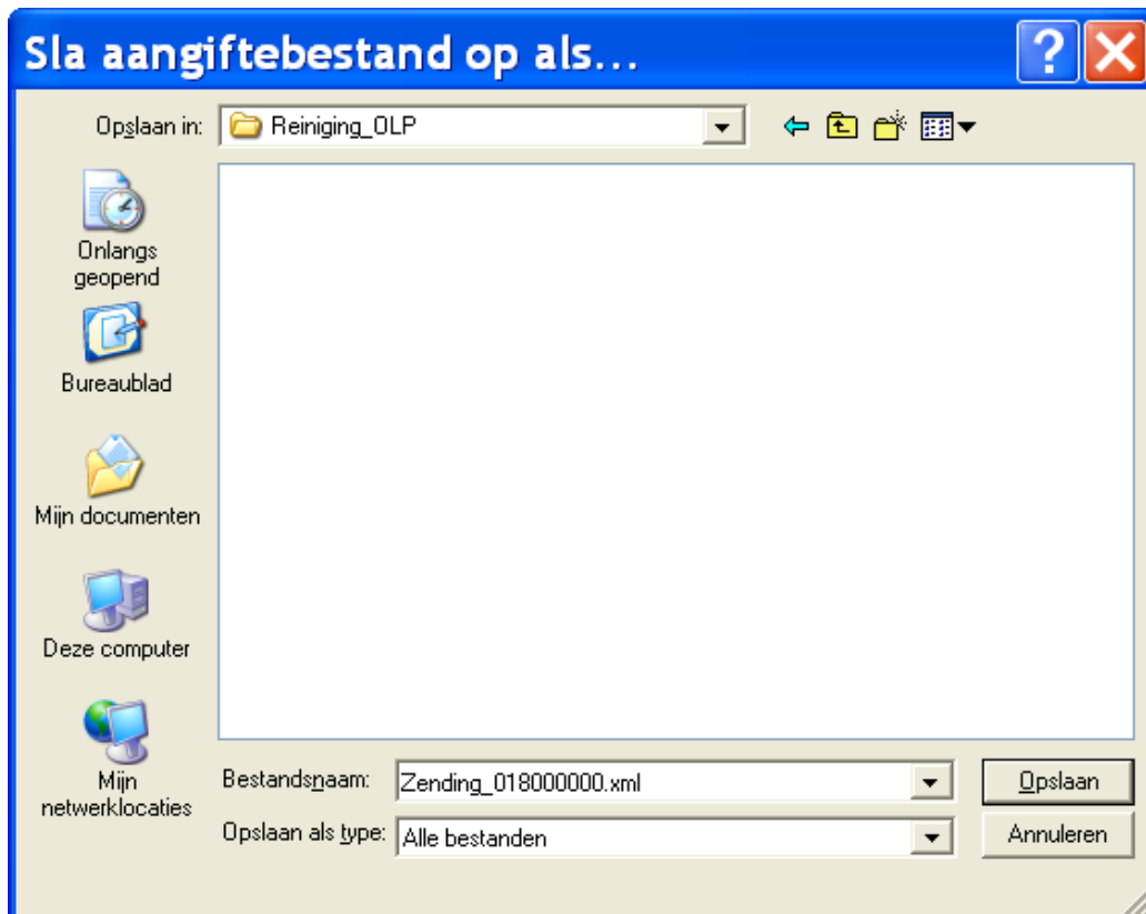
Afbeelding: Het dialog- en invulvenster Cordares OLP Reiniging, Opslaan

9) U kunt het bestand nu e-mailen naar administratienetschoonmaak.nl . Druk daartoe op de knop 'E-mail':