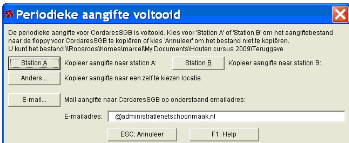
Afbeelding: Het dialoogvenster Cordares OLP Reiniging, Voltooid

9) U kunt het bestand nu e-mailen naar administratienetschoonmaak.nl . Druk daartoe op de knop 'E-mail':