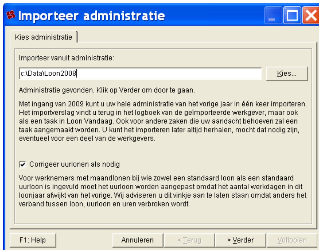
Het dialoogscherm 'Importeer administratie', 'Corrigeer uurlonen als nodig'