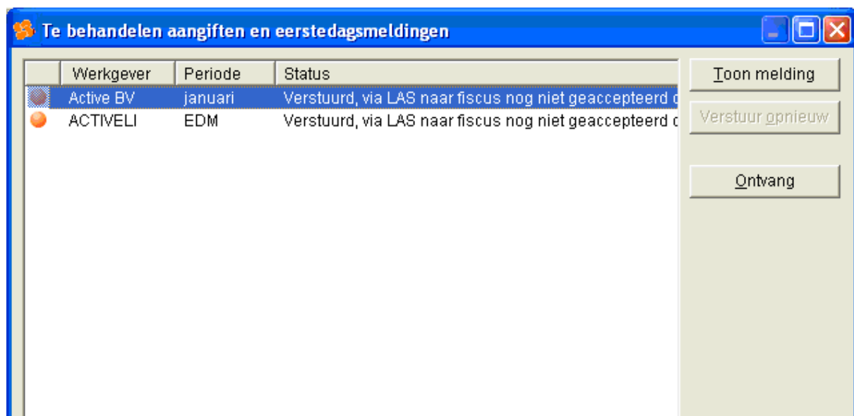
Afbeelding: Het dialoogvenster Te behandelen Aangiften Uitleg functie 'Ontvang'

Eén en ander kunt u zien via 'Loon Vandaag', 'Postbus' (helemaal bovenin), 'Te behandelen aangiften':