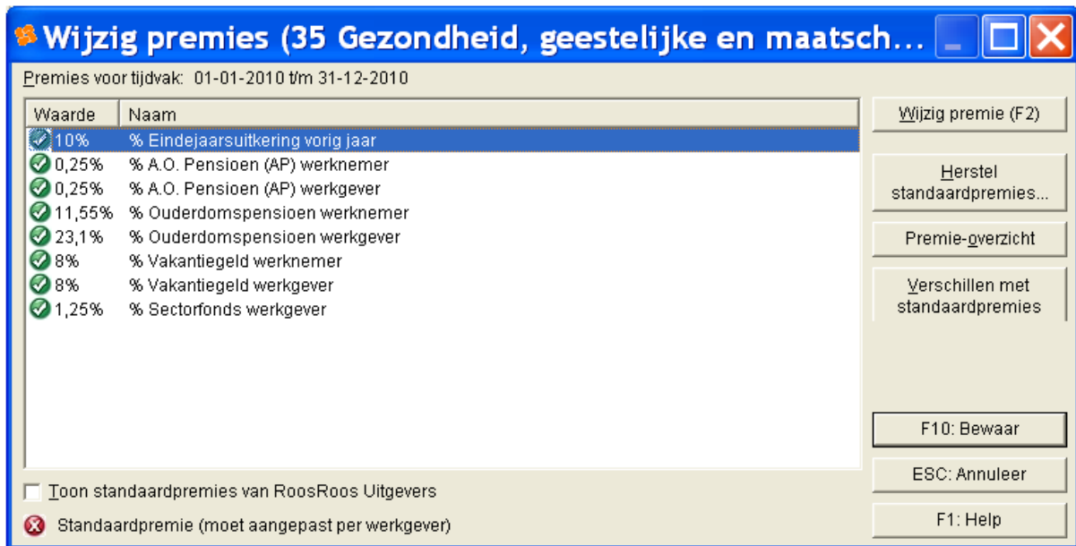
Afbeelding: Het dialoog- en invulvenster Werkgever, Wijzig premies