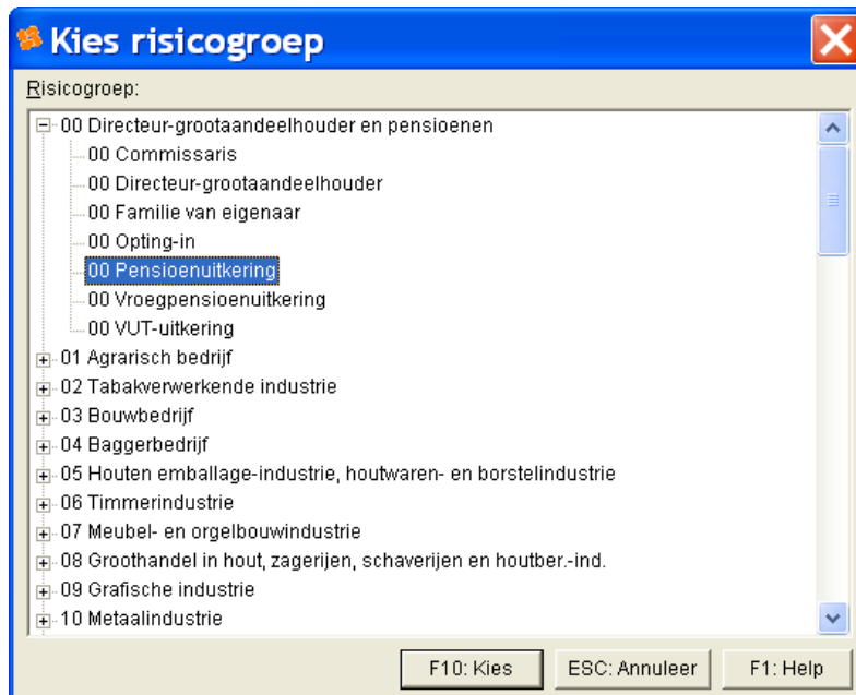
Afbeelding: Het dialoogvenster Werknemersgegevens , Kies risicogroep