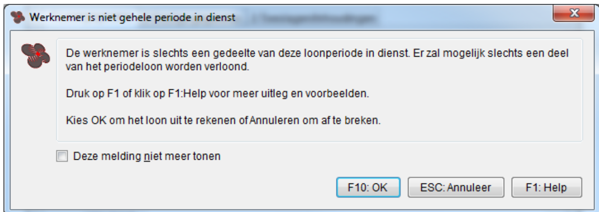
Afbeelding: Werknemer niet gehele periode in dienst

Loon geeft u voor de verloning van de indienstperiode eerst deze melding: