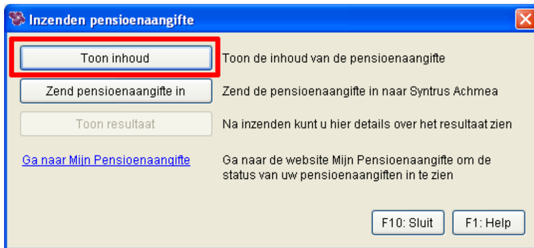
Afbeelding: 'Overzichten', 'Periodieke opgaven', 'Pensioenaangifte', 'Toon inhoud'