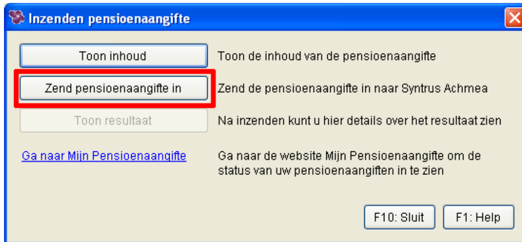
Afbeelding: 'Overzichten, 'Periodieke opgaven, 'Pensioenaangifte', 'Zend in'

Als u de data gecheckt hebt, en in orde bevonden dan geeft u 'F10:OK'. U kunt nu de pensioenaangifte echt gaan insturen met de knop 'Zend pensioenaangifte in':